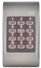
Hintergrundbeleuchtung rot Zutritt verweigert