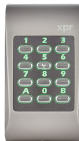
Hintergrundbeleuchtung grün Zutritt gewährt

Das MTPADP-RS-EH hat eine orangefarbene Hintergrundbeleuchtung. Das Tastenfeld ändert die Farbe seiner Hintergrundbeleuchtung, wenn ein Code oder Ausweis eingegeben/vorgehalten wird.