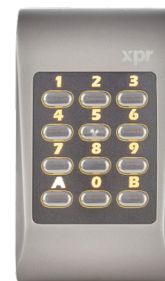
Hintergrundbeleuchtung orange Stand-by Modus