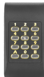
Hintergrundbeleuchtung orange Stand-by Modus