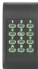
Hintergrundbeleuchtung grün Zutritt gewährt

Das MTPADP-RS-MF hat eine orangefarbene Hintergrundbeleuchtung. Das Tastenfeld ändert die Farbe seiner Hintergrundbeleuchtung, wenn ein Code oder Ausweis eingegeben/vorgehalten wird.