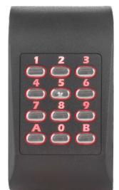
Hintergrundbeleuchtung rot Zutritt verweigert