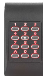
Retroiluminado rojo Acceso denegado