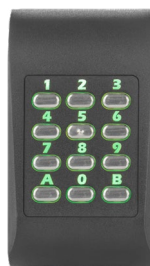
Retroiluminado verde Acceso autorizado