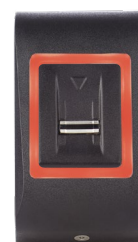
Rote LED blinkt Zutritt verweigert