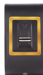
Orangefarbene LED Standby Modus