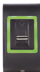
Grüne LED Zutritt gewährt